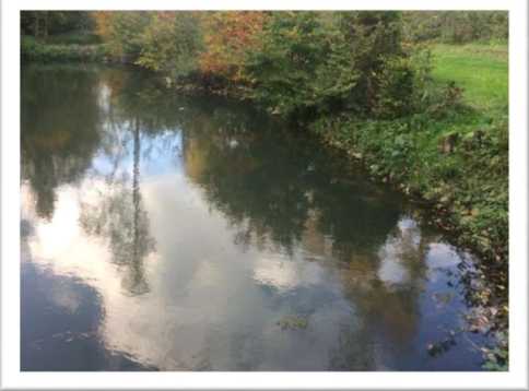
Beispiele geeigneter Besatzgewässer für Edelkrebse.

Für Meldungen und Rückfragen, wenden Sie sich gern an uns: